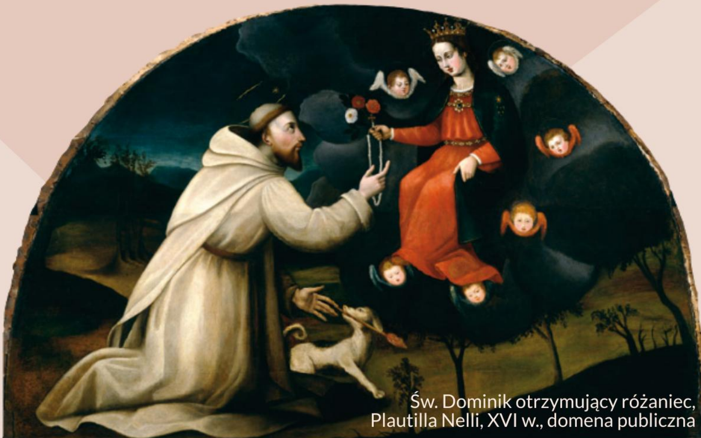
Św. Dominik otrzymujący różaniec, Plautilla Nelli, XVI w., domena publiczna

Dominik oznaczył się szczególnym nabożeństwem do Maryi. Według tradycji to on zainicjował zwyczaj medytacji nad życiem Jezusa w formie modlitwy różańcowej i stał się jej popularyzatorem.