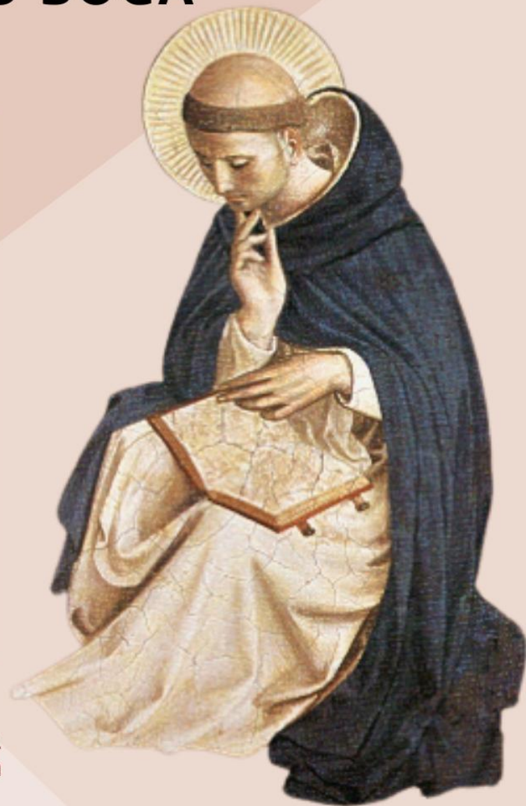
Fra Angelico, XV w.

W 1196 roku Dominik przyjął święcenia kapłańskie. Wkrótce potem został wybrany na kanonika kapituły katedralnej w swojej rodzinnej diecezji w Osmie. Traktował tę zaszczytną funkcję jako służbę, którą chciał pełnić z pokorą i oddaniem. Głosił słowo Boże, ale przede wszystkim sam prowadził głębokie życie duchowe.