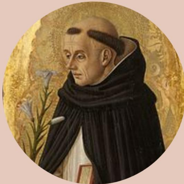
Carlo Crivelli, 1472 r. domena publiczna