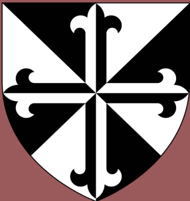
Herb dominikanów, domena publiczna