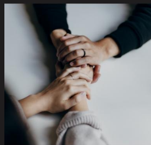
POCHŁEBSTWA I SŁUŻALCZOŚĆ