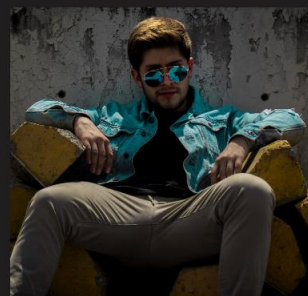
PRÓŻNOŚĆ I SAMOCHWALSTWO