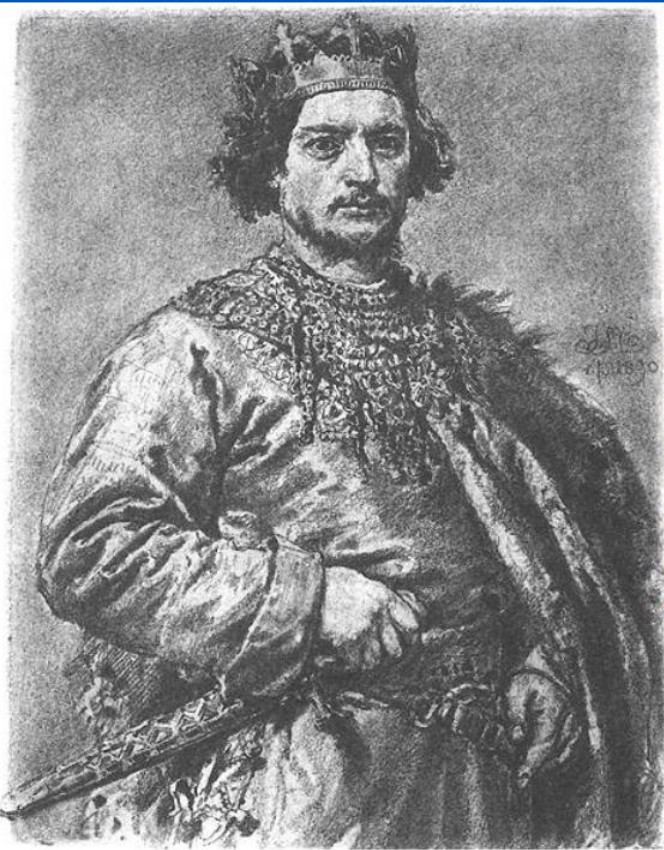
Bolesław Śmiały, Jan Matejko, ok. 1890-1892