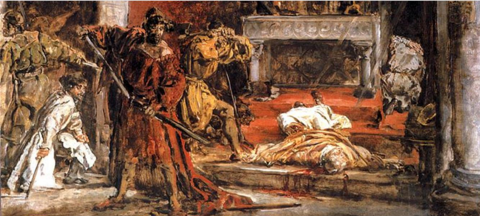
Zabójstwo św. Stanisława, Jan Matejko, 1892