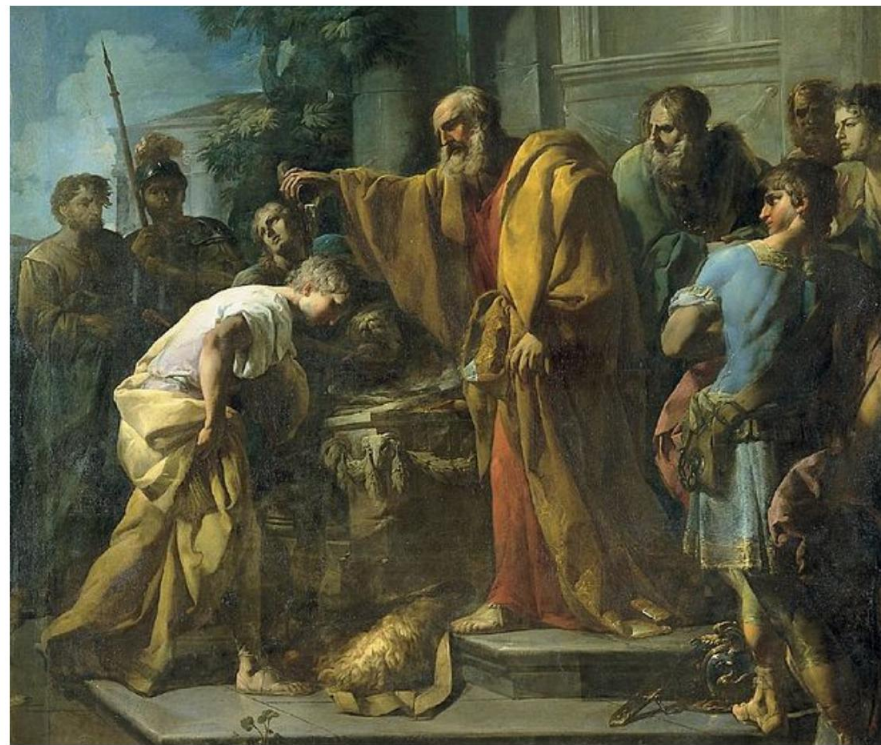
Antonio González Velázquez, XVIII w.

Samuel mężnie wzywał Izraelitów do nawrócenia i odrzucenia pogańskich praktyk. Dzięki wierności Bogu przyczynił się do pokonania Filistynów. Choć nie podobało mu się wprowadzenie monarchii w Izraelu, wypełnił rozkaz Pana i namaścił pierwszych królów: Saula i Dawida.