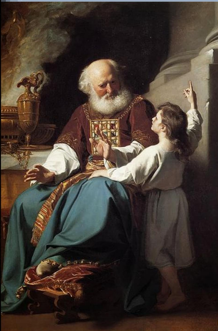
John Singleton Copley, 1780