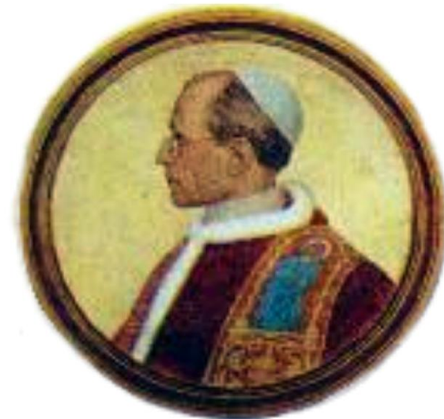
Papież Pius XII

Dominik, nazwany przez Piusa XI „małym świętym” i „gigantem ducha”, jest patronem ministrantów oraz dzieci i młodzieży .