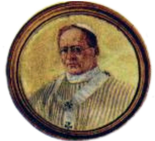
Papież Pius XI

Blisko 100 lat później – w 1954 r. – papież Pius XII ogłosił go świętym Kościoła.