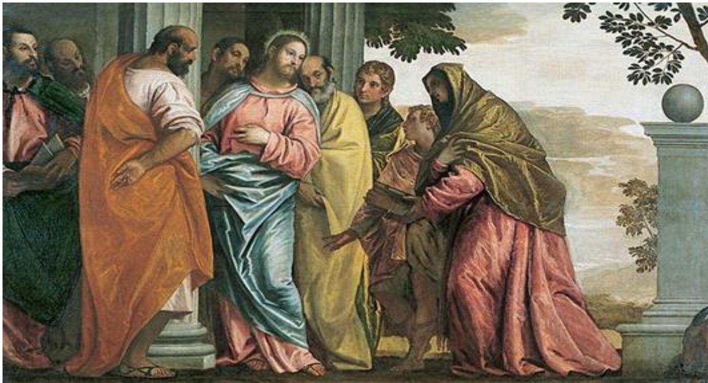
Paolo Veronese, Chrystus spotyka synów Zebedusza i ich matkę