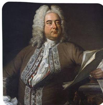
Georg Friedrich Händel Thomas Hudson, 1741