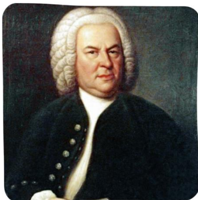
Johann Sebastian Bach Elias Gottlob Haussmann, 1748