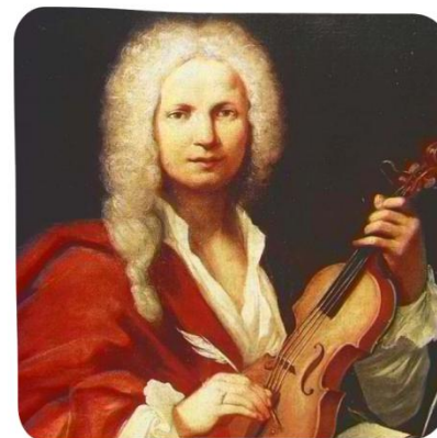
Antonio Lucio Vivaldi Autor nieznany, 1723