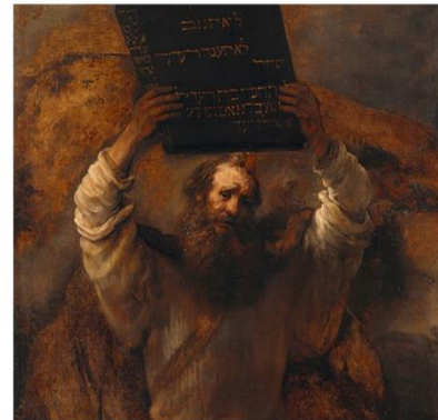
Rembrandt, Mojżesz z tablicami prawa, 1659