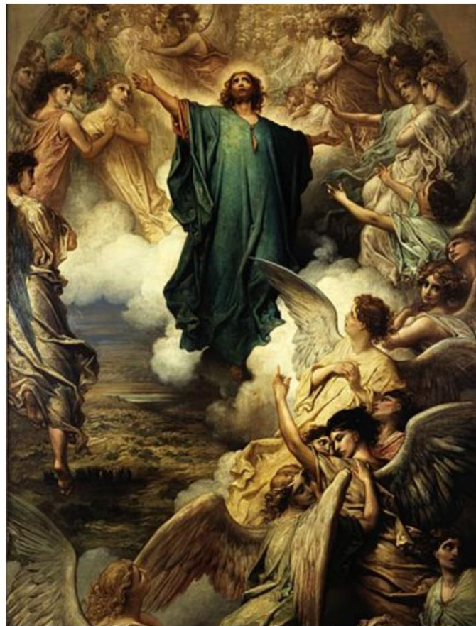
Gustave Doré, Wniebowstąpienie, 1879

Po Jego wstąpieniu do nieba zaczęli spisywać naukę Mistrza, by dotarła do wszystkich ludzi.