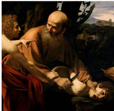
Caravaggio, Ofiarowanie Izaaka, 1603