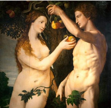
Frans Floris I, Upadek człowieka, 1560

To miłosny list Boga do człowieka. Są w nim opisane historie, które pokazują, jak bardzo Bóg kocha człowieka i jak o niego walczy.