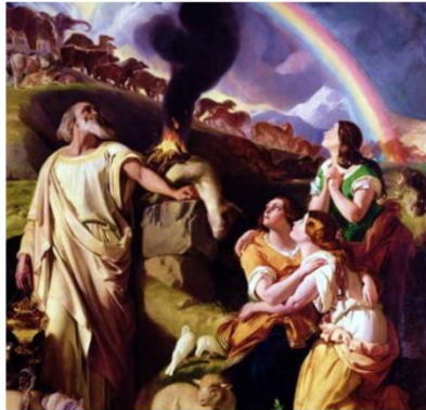
Daniel Maclise, Przymierze z Noem, XIX w.