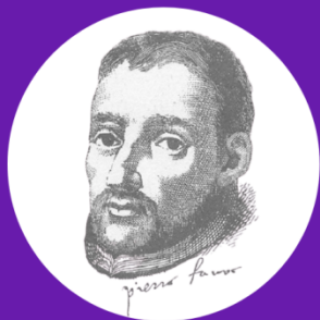
Piotr Faber (1506 - 1546)

Wśród przyjaciół Ignacego byli m.in. późniejsi święci: