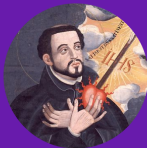
Franciszek Ksawery (1506 - 1552)