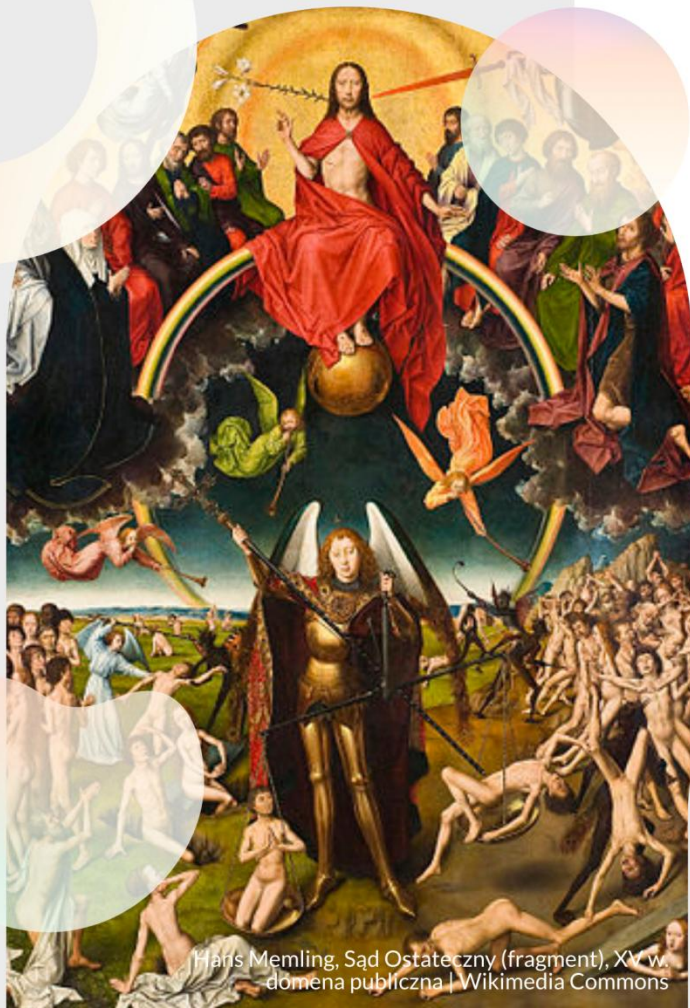
Hans Memling, Sąd Ostateczny (fragment), XV w.