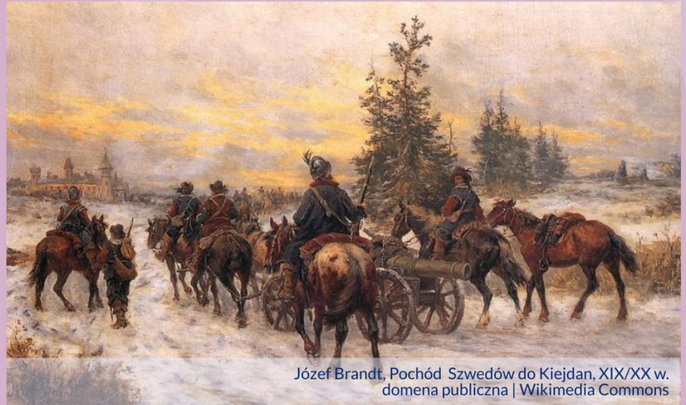
Józef Brandt, Pochód Szwedów do Kiejdan, XIX/XX w.

Gdy Szwedzi – wbrew deklaracjom o poszanowaniu wiary katolickiej – zaczęli rabować kościoły i klasztory, a nawet mordować duchowieństwo, Polacy zmobilizowali się do walki.