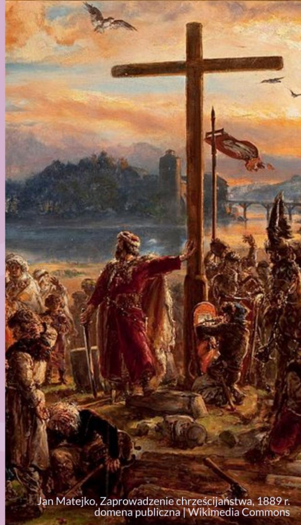
Jan Matejko, Zaprowadzenie chrześcijaństwa, 1889 r.

Od momentu chrztu Mieszka I dzieje naszej Ojczyzny są nierozdzielnie związane z Kościołem. W ciągu wieków Kościół wielokrotnie udawał, że nie tylko towarzyszy narodowi polskiemu, lecz także broni jego wolności i godności.