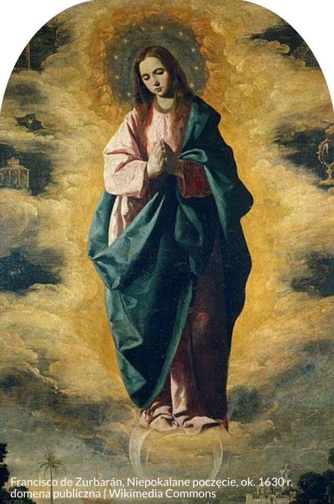
Francisco de Zurbarán, Niepokalane poczęcie, ok. 1630 r. domena publiczna | Wikimedia Commons