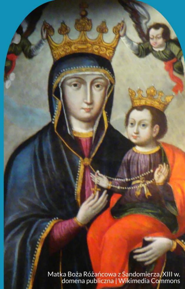
Matka Boża Różańcowa z Sandomierza, XIII w.

Wielokrotnie zachęcała do odmawiania różańca - modlitwy kontemplacyjnej , która może stać się narzędziem przywracania pokoju w świecie, uzdrowienia duszy i ciała, skutecznej pomocy душom czyścicowym i ratunkiem dla grzeszników.