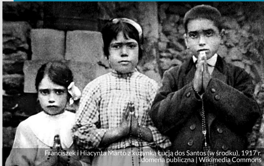
Franciszek i Hiacynta Marto z kuzynką Łucją dos Santos (w środku), 1917 r.