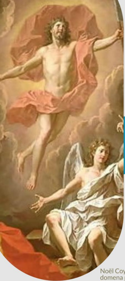
Noël Coypel, Zmartwychwstanie Chrystusa, 1700 r.