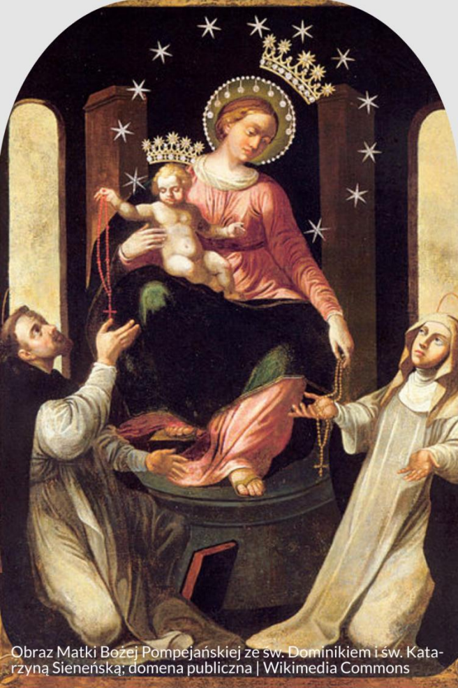
Obraz Matki Bożej Pompejańskiej ze sw. Dominikiem i sw. Katarzyną Sienieńską