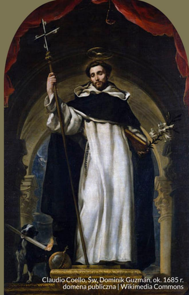
Claudio Coello, Św. Dominik Guzmán, ok. 1685 r.

Zapoczątkowanie tej modlitwy przypisuje się św. Dominikowi Guzmanowi (1170–1221). Porównywano ją do wręczania Matce Bożej kwiatów, dlatego została nazwana wieńcem z róż - różańcem .