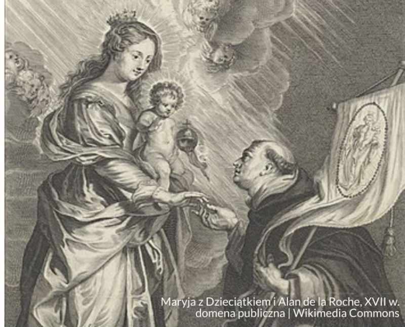
Maryja z Dzieciątkiem i Alan de la Roche, XVII w.

Obecny kształt modlitwy różańcowej zawdzięczamy dominikaninowi Alanowi de la Roche (1428-1476). Na wzór 150 Psalmów ustalił liczbę 150 „Zdrowaś, Maryjo” (we wszystkich 3 częściach) i podzielił różaniec na dziesiątki przeplatane modlitwą „Ojcze nasz”.