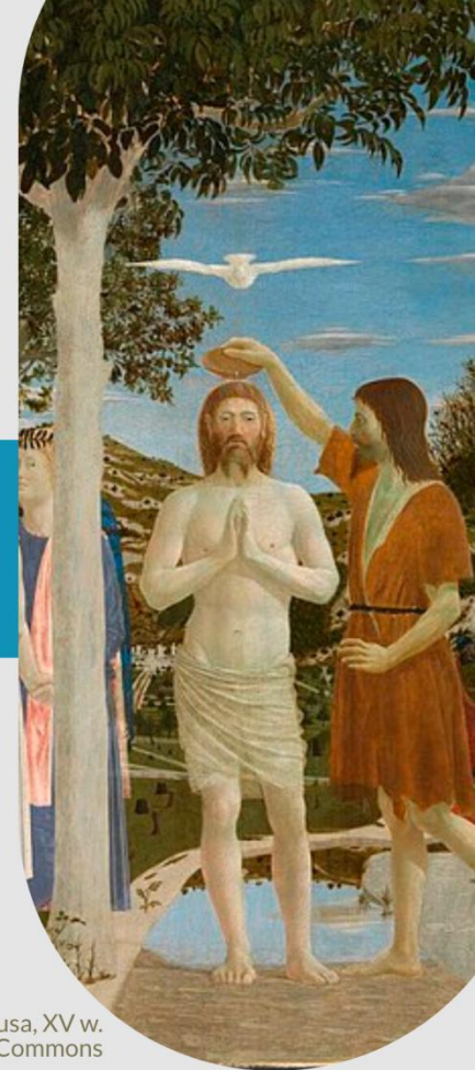
Piero della Francesca, Chrzest Chrystusa, XV w.