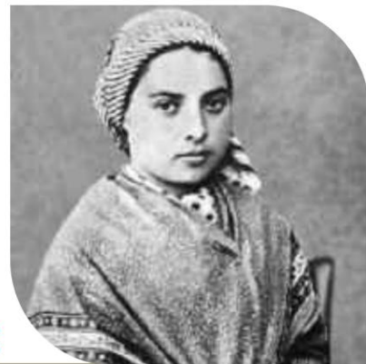
Św. Bernadetta Soubirous, przed 1879 r.

Była to Maryja, wzywająca ludzi do modlitwy i nawrócenia. Podczas objawień Bernadetta odmawiała różaniec.