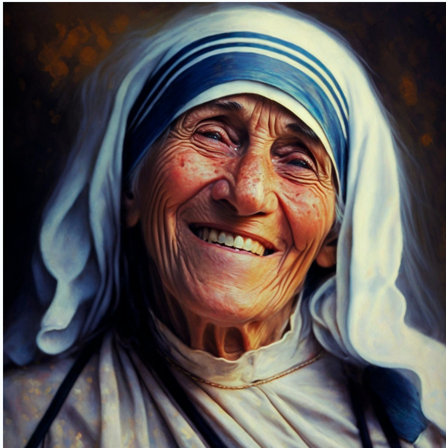
ŚW. MATKA TERESA Z KALKUTY