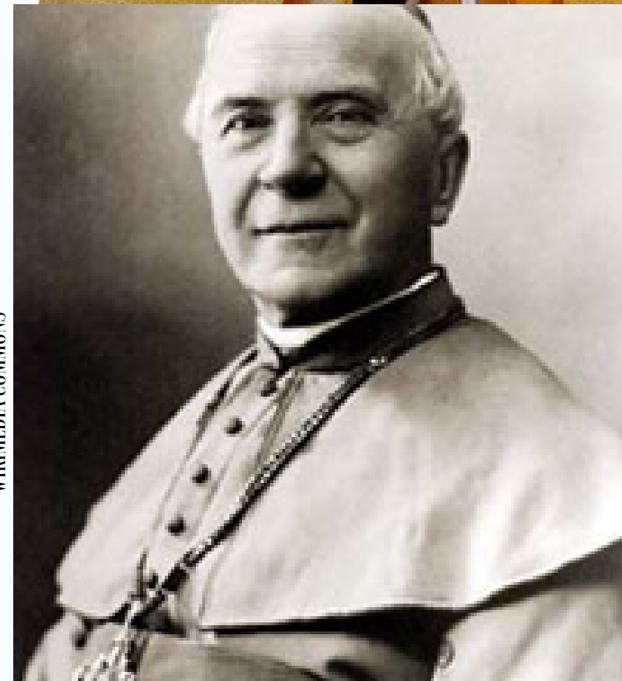
ŚW. JÓZEF SEBASTIAN PELCZAR