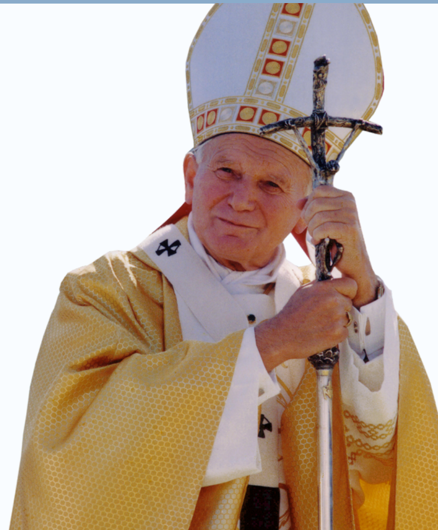
ŚW. JAN PAWEŁ II