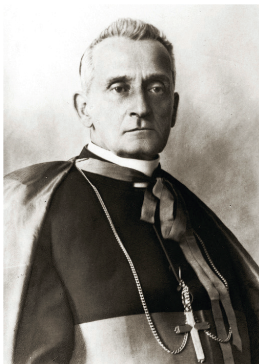
Metropolita krakowski Adam Sapieha

który pod nieobecność prymasa Augusta Hlonda stał się nieformalnym przywódcą Kościoła w Polsce. Metropolita miał żywe kontakty z polskim podziemiem i doskonale orientował się w sytuacji pod okupacją niemiecką, dlatego interweniował u gubernatora Franka, a nawet u samego Hitlera w sprawie łapanek, wywozu Polaków na przymusowe roboty lub do obozów śmierci, a także w obronie mordowanych Żydów. To również on już pod koniec 1939 r. powołał Obywatelski Komitet Pomocy i popierał działalność Polskiego Czerwonego Krzyża oraz Rady Głównej Opiekuńczej.