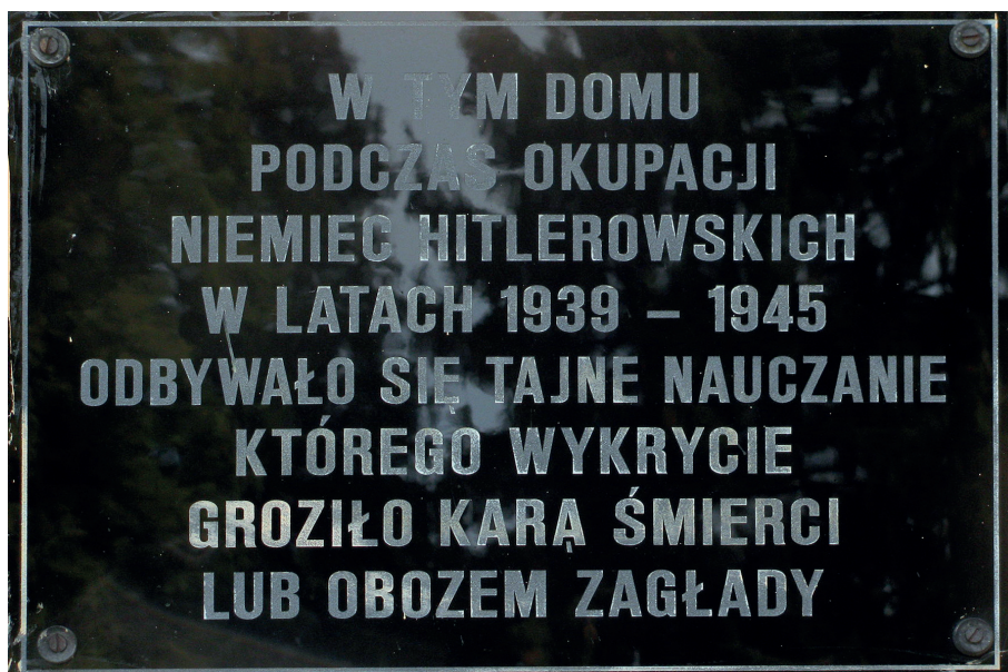
Tablica upamiętniająca tajne nauczanie odbywające się w jednym z domów w Gorlicach

Duchowni i siostry zakonne zajmowali się też działalnością oświatową i współorganizowaniem tajnego nauczania.