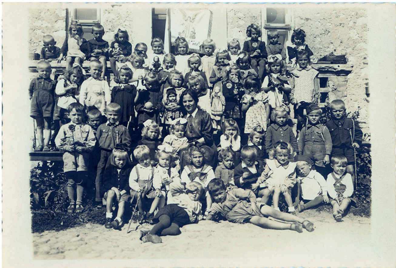
Zgromadzenie Sióstr Westiarek Jezusa, ochronka w Pajęcznie

Z organizacjami o charakterze charytatywnym współpracowała kościelna Caritas. Do wielu akcji dobroczynnych włączały się zakony męskie i żeńskie. Otwierały one swoje domy dla wysiedlonych, uciekinierów i ukrywających się, organizowały kuchnie oraz opiekę nad sierotami, chorymi i starcami.