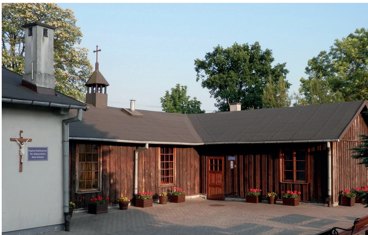
Stara kaplica z 1927 r. w Niepokalanowie – obecnie lokalne sanktuarium św. Maksymiliana.

Po powrocie do Polski w 1919 r. leczył ciężką chorobę płuc. Mimo fizycznego osłabienia, rozwijał ideę Milicji Niepokalanej. Już po kilku miesiącach przyjął pierwszych rycerzy, a w 1922 r. rozpoczął wydawanie czasopisma „Rycerz Niepokalanej”. W 1927 r. w pobliżu Warszawy założył nowy klasztor – Niepokalanów. Po dziesięciu latach mieszkało w nim już ok. 760 zakonników.