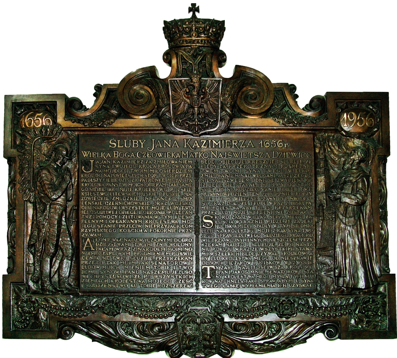
Tablica pamiątkowa z tekstem ślubów w sali rycerskiej katedry na Jasnej Górze