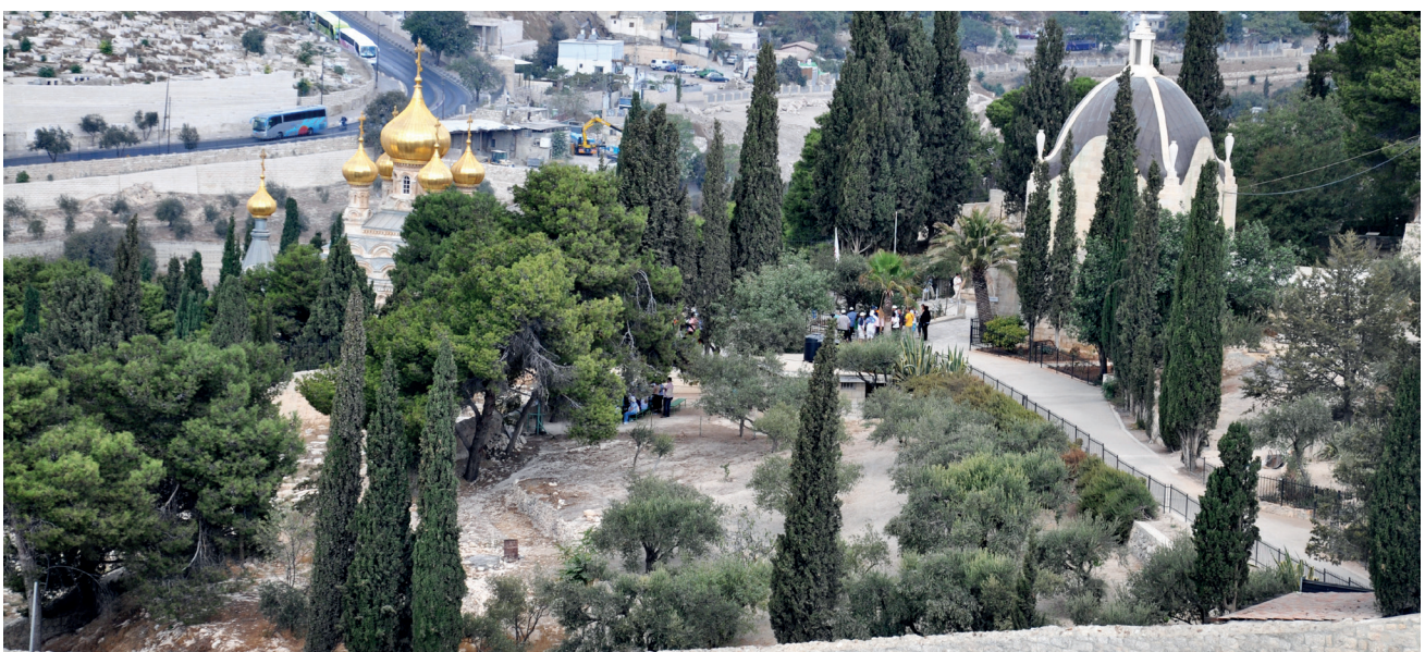
Ogród Getsemani, Jerozolima